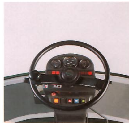
Ein Armaturenbrett, wie es sein soll, der Fahrer hat hier alles im Blick.