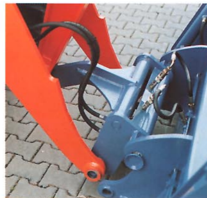
Die serienmäßige installierte hydraulische Schnellwechsel-Kupplung ist in die Ladestangen integriert.