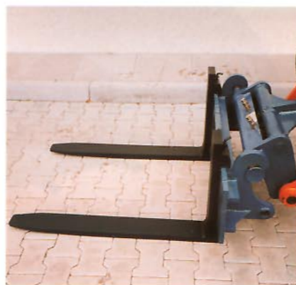
Die Gabelstapler-Einrichtung ist nur eine von vielen Möglichkeiten, die Kubota für seine Radlader anbietet.